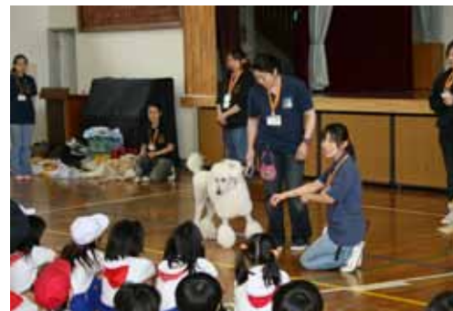
小学校での動物介在介入の実践