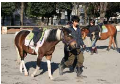
トレーニング実習