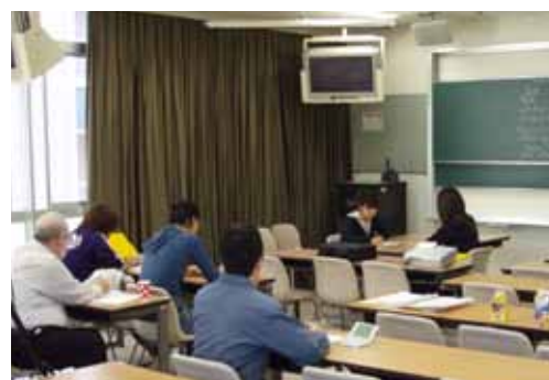
ディスカッショントレーニング